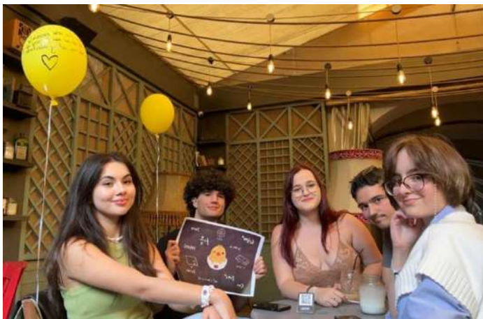
Echipea Gigantii Tehnici (🏆 Locul 1 🏆)

În urma celor 7 zile în care participanții s-au întrecut să obțină cât mai multe puncte din realizarea provocărilor lansate de noi, s-au calificat la proba de departajare 3 echipe: Flyin' pup , The_Explorers , Gigantii Tehnici . Proba de departajare a constat în rezolvarea cât mai corectă și cât mai rapidă a unui quiz cu tema UTC-N. Clasamentele finale au fost afișate pe paginile de Facebook Consiliere Universitatea Tehnica .