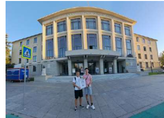
Doi barzi ardeleni întâmpină tinerii însetați de cultură. (Provocarea 5 / CJ)