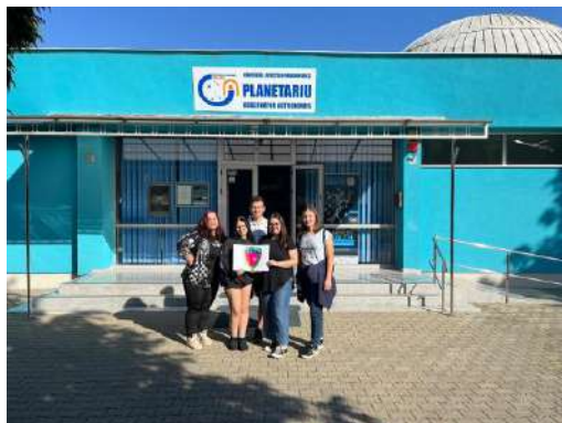
Din această locație albastră îți aduci cerul mai aproape. (Provocarea 2 / CUNBM)