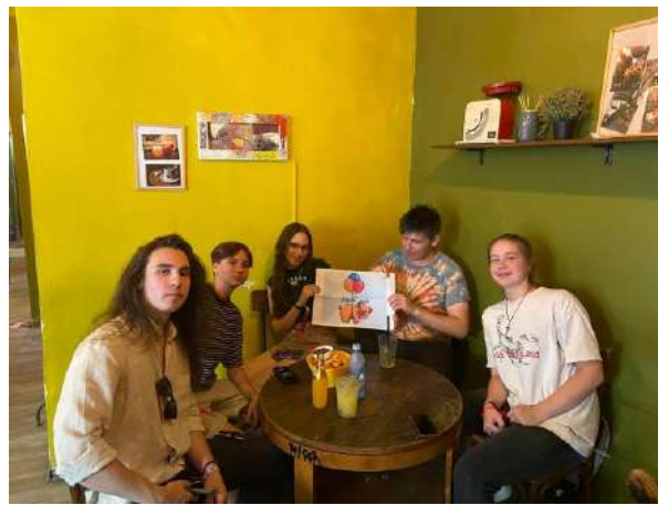
Echipea Flyin' Pup (🏆 Premiu finalist 🏆)