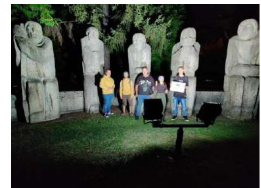
Cinci bătrâni se sfătuiesc. (Provocarea 4 / CUNBM)