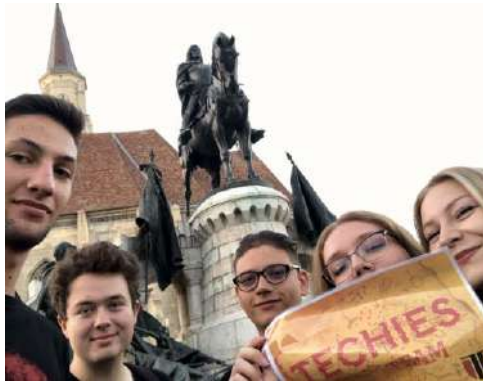
Cinci prieteni salută solemn clienții Băncii Naționale. (Provocarea 1 / CJ)