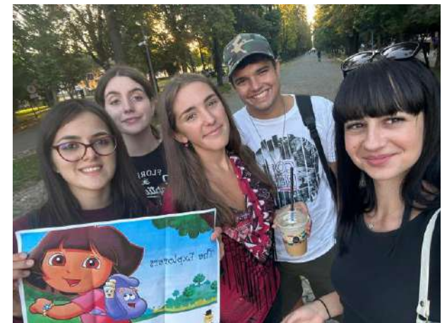
Echipea The_Explorers (🏆 Premiu finalist 🏆)