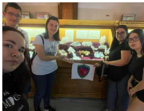
Aici poți vedea cea mai vastă colecție de flori crescute în adâncuri. (Provocarea 3 / CUNBM)